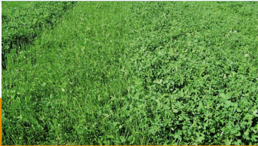
Wirkung von Schwefel im Klee gras vor dem ersten Schnitt, rechts mit und links ohne Düngung; Hohenkammer 2012

Da die Beurteilung der Wirkung subjektiv war, kann sie nur einen Hinweis auf einen